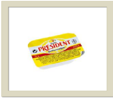
Tabla de alérgenos